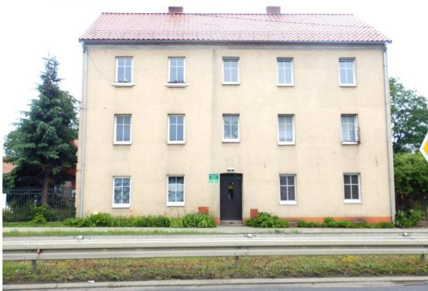
Widok elewacji frontowej – Rybacka 4

na sprzedaż lokalu mieszkalnego Nr 3 znajdującego się w budynku położonym w Lubaniu przy ul. Rybackiej 4 wraz z udziałem we współwłasności nieruchomości gruntowej (działka nr 3/16, AM 8, Obręb III o powierzchni 618 m 2 , JG1L/00034896/4)